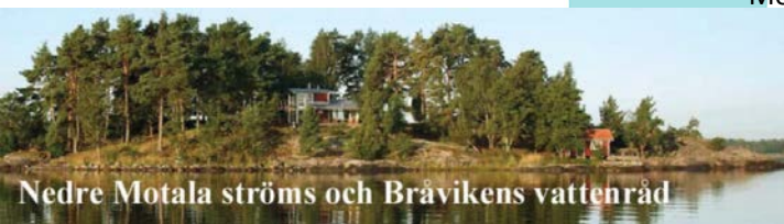
Nedre Motala ströms och Bråvikens vattenråd