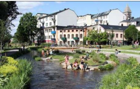
Strömparken, centrala Norrköping